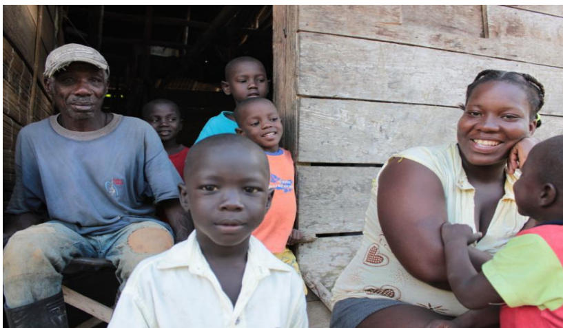
Julián Rinaudo. Familia Afrocolombiana . 2010.

Para caracterizar a la población negra afrocolombiana es relevante presentar algunas precisiones y aclaraciones alrededor de las diferentes acepciones con las que se hace referencia a este grupo poblacional. Afrocolombiano (a), negro (a), afrocolombianeidad y negritud, negritudes, son términos utilizados en numerosas ocasiones, indistintamente, sin tener en cuenta las implicaciones de utilizar uno u otro, y sin tener claridad de cuál es la referencia adecuada según el contexto histórico, jurídico, regional y político.