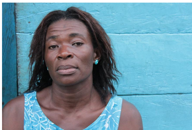
Julian Rinaudo. Mujer afro en fondo azul . 2010.

El impacto del accionar de los diferentes grupos armados al margen de la ley sobre las mujeres en Colombia, ha sido diferencial, y se ha ejercido de manera especialmente desproporcional contra las mujeres de grupos étnicos. El impacto negativo que ha tenido la violencia en los cuerpos y en las vidas de las mujeres, sumando a la discriminación, la exclusión y la violencia de género ha sido denunciado en términos urgentes por diversas instancias nacionales e internacionales en los últimos años. Según Libia Grueso: