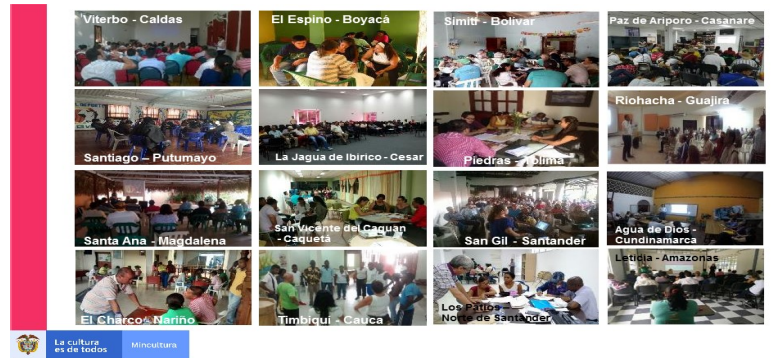
IMAGEN DEL PROYECTO