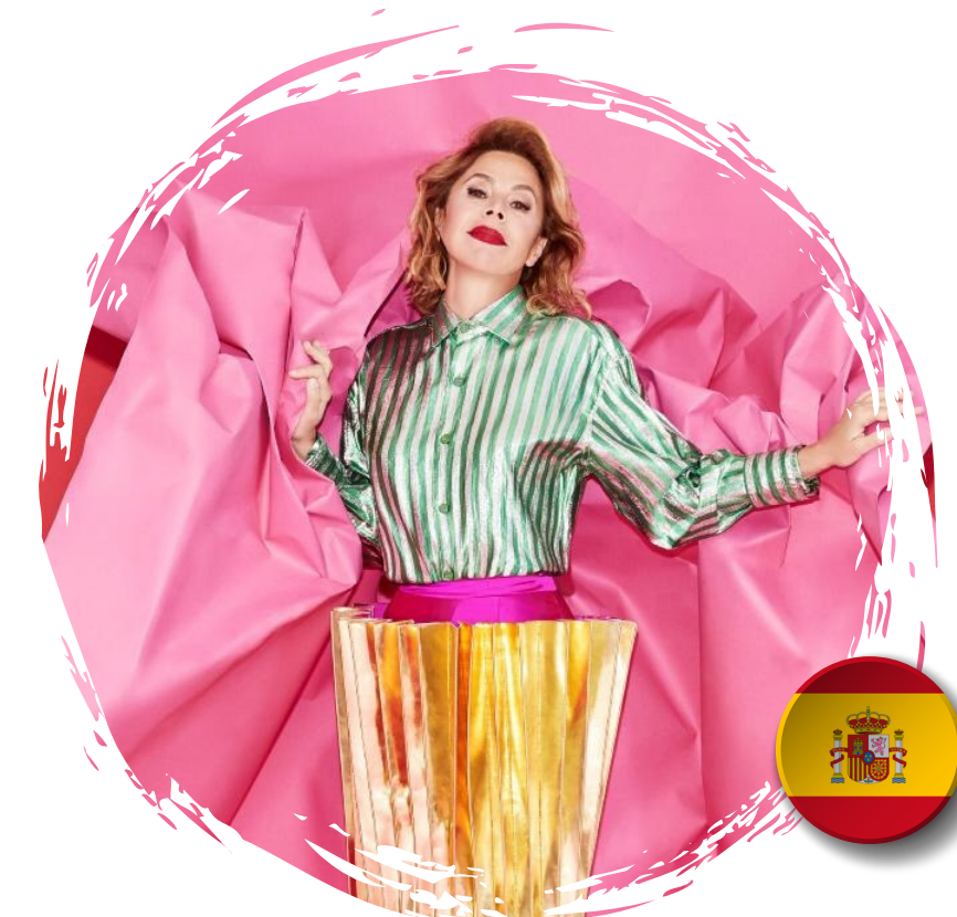
Ágatha Ruiz de la Prada