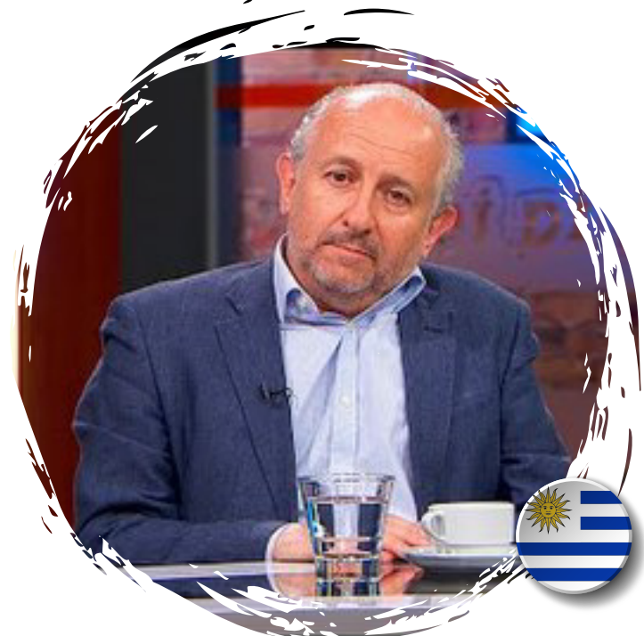
Pablo da Silveira

Ministra de Género, Cultura, Entretenimiento y Deporte de Jamaica