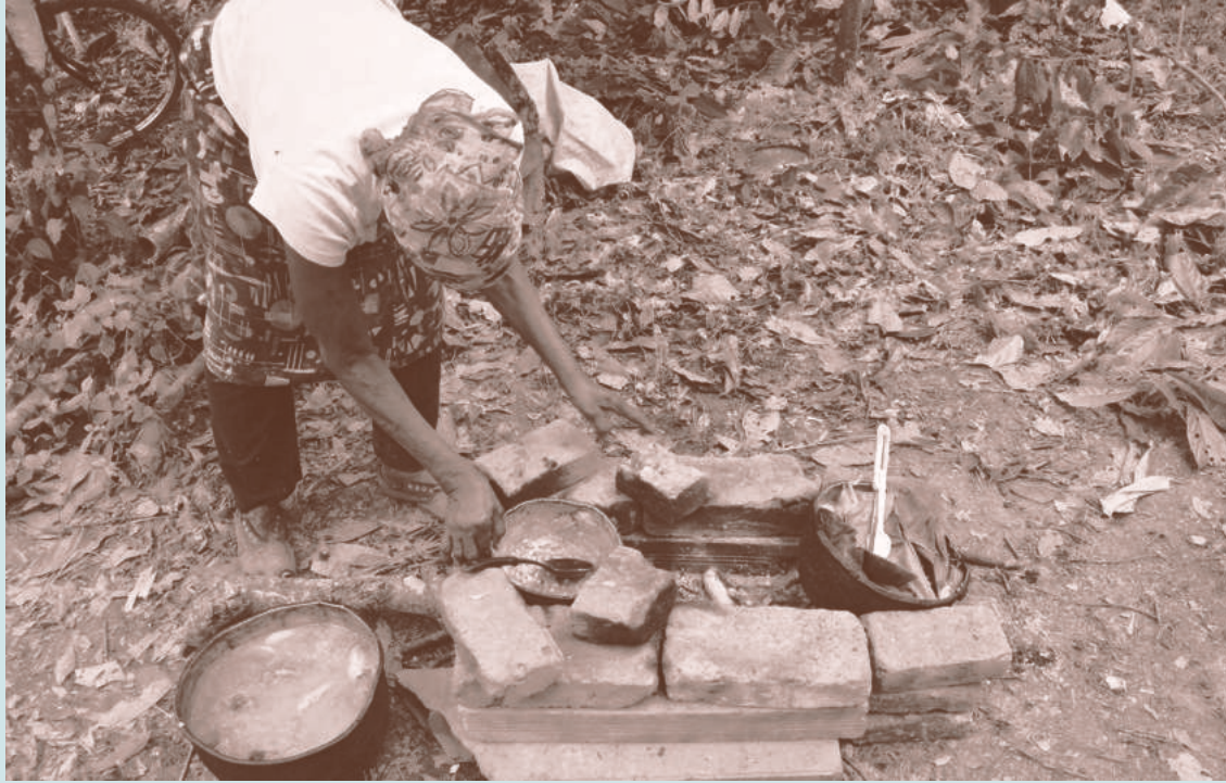
El fogón de leña.

Esta iniciativa enfrenta tres problemáticas: la expansión del monocultivo de caña de azúcar, que ocupa más del 50 % del territorio de cada municipio; la presencia de cultivos transgénicos de maíz y soya, que generan la pérdida de semillas criollas y nativas; y la minería de arcilla, con 1 200 hectáreas tituladas, donde se extrae arcilla para la construcción. Estas minas dejan hoyos de más de 40 metros de profundidad, que se llenan de agua de lluvia, alterando los niveles freáticos y contaminando los aljibes.