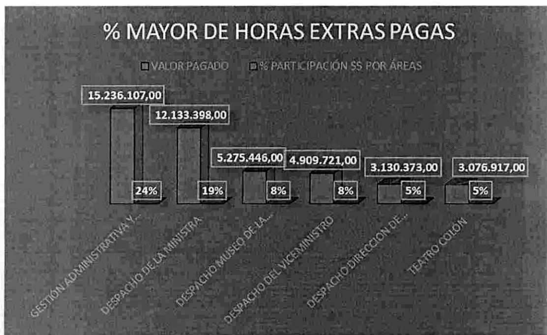
Gráfica No1 Mayor gasto de horas extras pagadas por dependencias

Las siguientes dependencias obtuvieron el mayor gasto por horas extras pagas dentro del trimestre , según lo reglamentado en el Decreto 1011 del 06 de junio de 2019 Ver Gráfica 1: