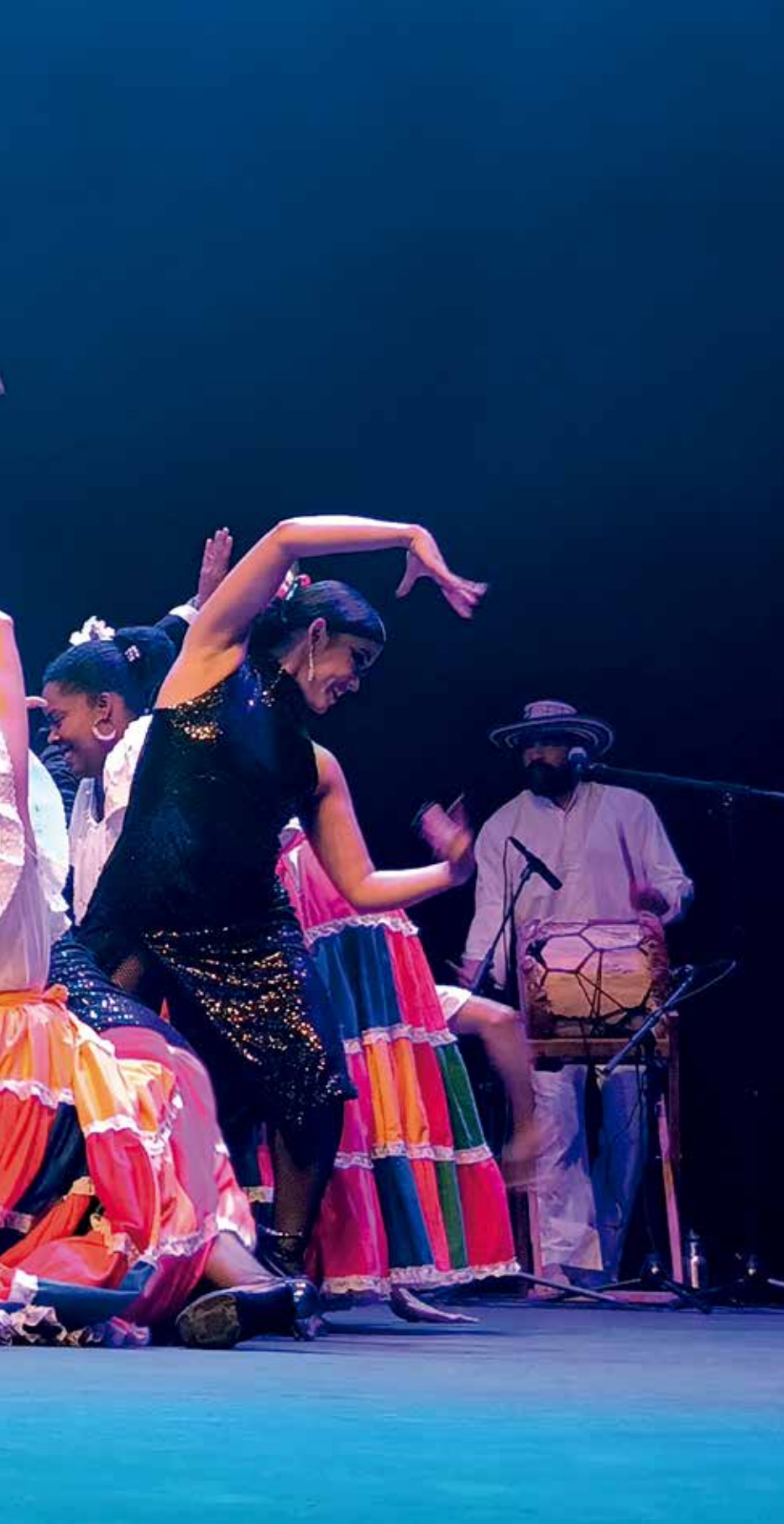
Puesta en escena Candumbia, 2025.