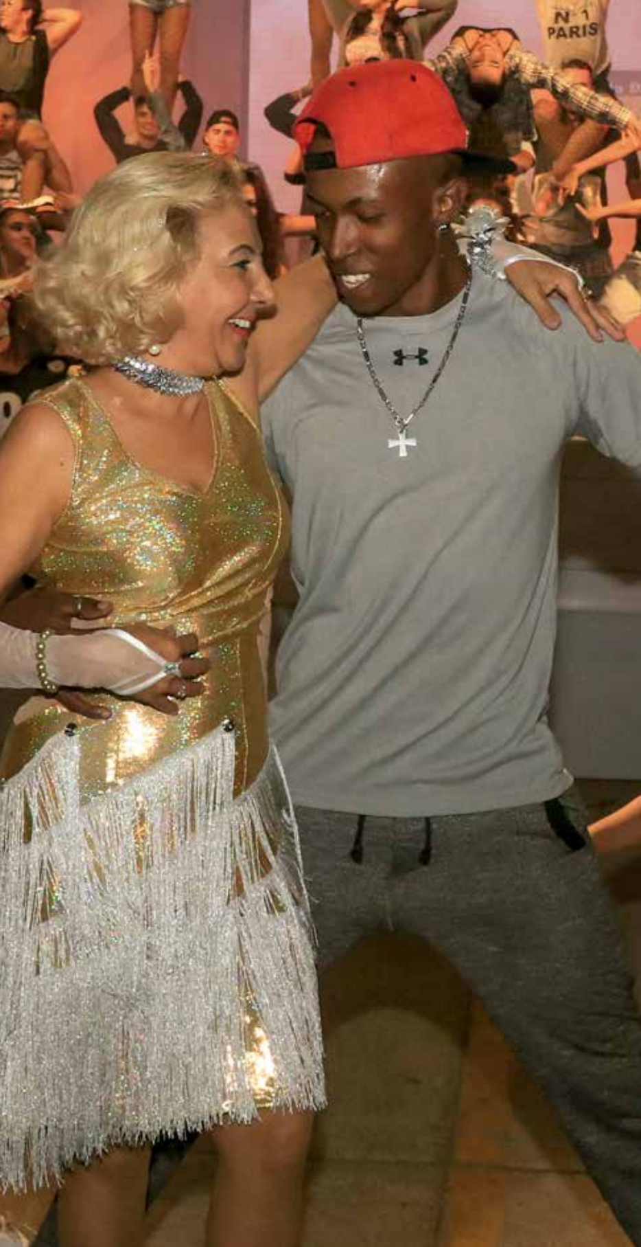
Danza itinerante, 2024. Boyacá.