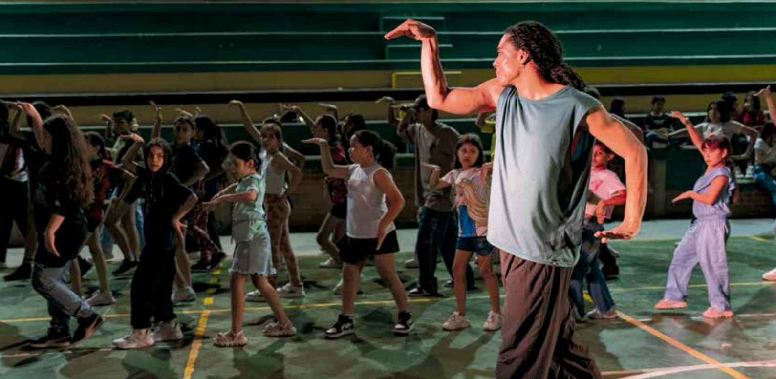
Danza itinerante, 2024. Santander.

El Ministerio de las Culturas, las Artes y los Saberes, junto a la Dirección del Área de Danza, realizó un Encuentro Nacional de Danza del 30 de noviembre al 3 de diciembre de 2023 en Paipa, Boyacá. El evento reunió a más de 120 agentes del sector, incluyendo bailarines, docentes, gestores culturales, coreógrafos y organizaciones dancísticas de diversas regiones del país, con el objetivo de fortalecer los procesos del sector de la danza a nivel nacional.