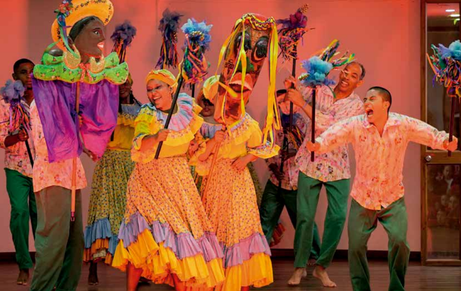
Danza itinerante, 2024. Boyacá.