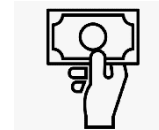
Préstamos y descuentos a título personal de proveedores o clientes de CoCrea.

Para mayor claridad, se debe considerar que los conflictos de intereses pueden presentarse de la siguiente manera: