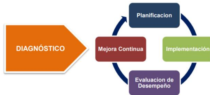
Ilustración 1: Ciclo de operación del modelo de seguridad y privacidad de la información, Fuente: MinTic - https://www.mintic.gov.co/gestioniti/615/articles-5482_Modelo_de_Seguridad_Privacidad.pdf