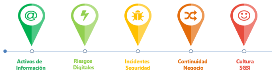
Ilustración 2: Gestión del Subsistema de Gestión de Seguridad de la Información - SGSI